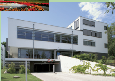
LAEKH-Fortbildungszentrum, Bad Nauheim